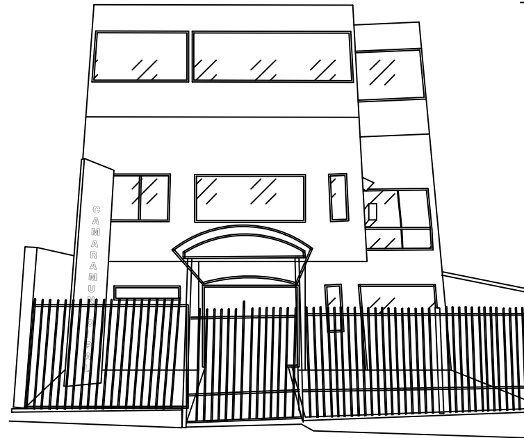
FACHADA ESC. 1:150